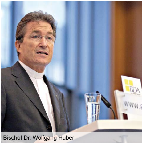
Bischof Dr. Wolfgang Huber